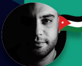
Firas Dahbour Firas Dahbour-Studio & Dental lab